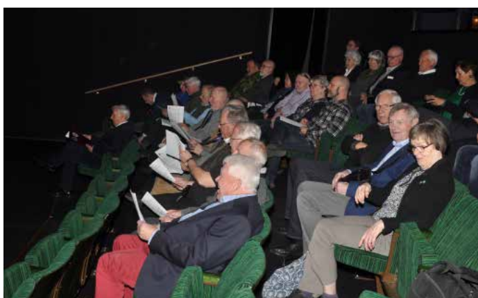
Församlade medlemmar lyssnar intresserat