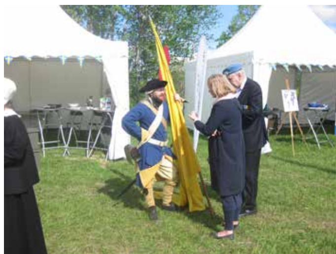
Armémuseum visade upp sin modell Å för hugade besökare.

Antalet besökare under årets veterandag var i paritet med föregående år. Kul att så många kommer och tar del av det vi har att visa upp