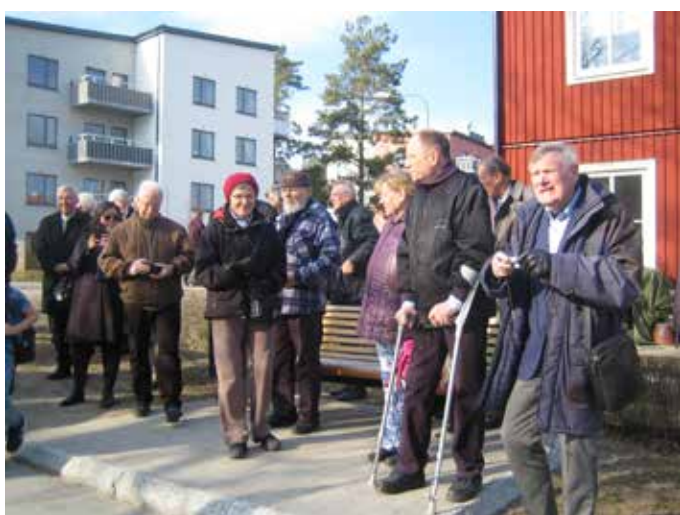
Ovan fler bilder från samlingen