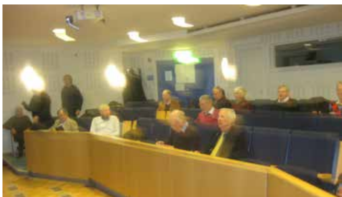
Några av deltagarna i samlingsalen

Den 5-6 mars genomfördes flygvapnets Kamratföreningars samverkansgrupp sjätte ordförandekonferens på Luftstridsskolan i Uppsala. Ordförandekonferensen genomförs vart annat år, i år med ett 30 tal deltagare. Totalt finns 26 kamratföreningar i flygvapnet. Årets konferens behandlade och presenterade närliggande intresseorganisationer till våra kamratföreningar samt orientering om flygvapnets gruppering och verksamhet i samband med nya organisationen från januari 2019.