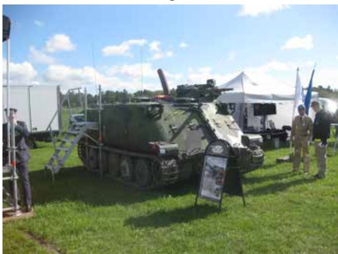
PBV som gjorde stor nytta i de internationella insatserna