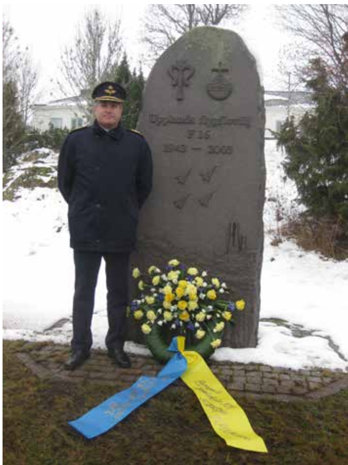
Flygvapenchefen vid minnesstenen i Uppsala i samband med rundresan 2016

Den första januari 2019 påbörjade alla försvarsgrensstaber verksamhet på nya orter. Flygvapnet med flygstab placeras på Ärna i Uppsala, armén med arméstab ligger i Enköping och marinen med marininstab ligger på Muskö.