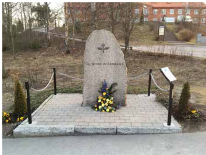
Arrangemanget runt stenen. Numera är också kledjan svartlackerad