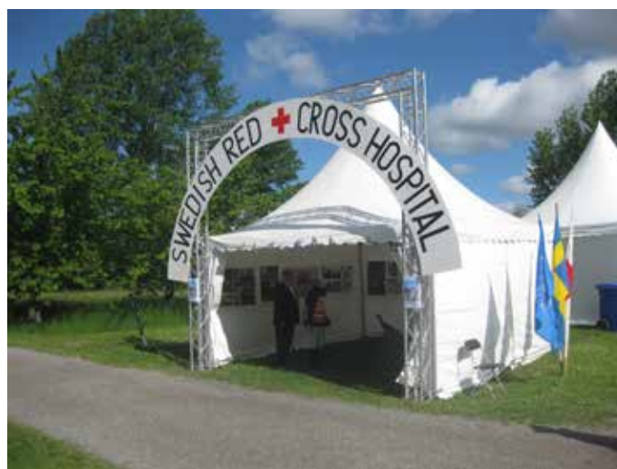
Svenska Röda Korset visade upp den entré som fanns vid det svenska fältsjukhuset i Busa, Syd Korea