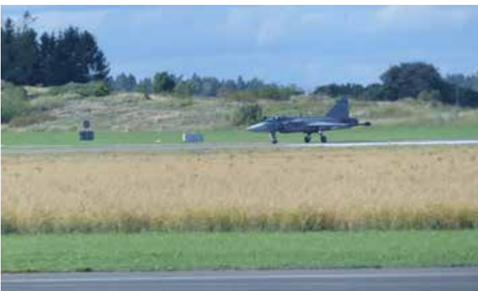
JAS 39 på Ärna i samband med flygdagen 2018

För Uppsala föreslogs bland annat återupprättandet av Upplands flygflottilj, F 16, ytterligare en strilbataljon, utökade basförband och värnplikt, nytt skolflyg samt att en till två stridsflygdivisioner bör stationeras i Uppsala. Detta kommer även att på ett omfattande sätt påverka vår utbildnings- och utvecklingsverksamhet.