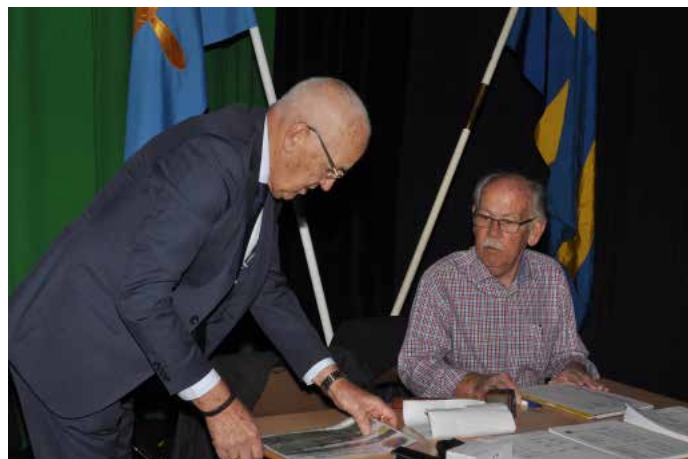
Ordning och reda bland dokumenten