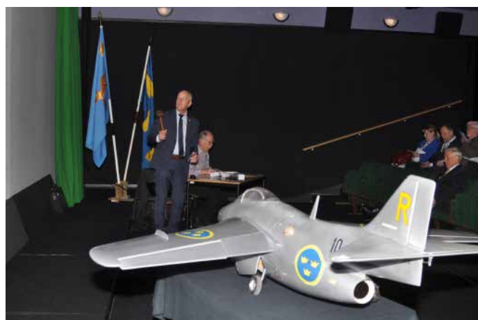
Nu kör vi