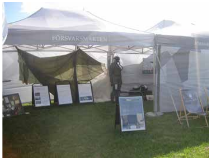
Vi kunde även se flygvapnets information på ett tilltalande sätt

Vi ser redan framemot nästa tillfälle som blir den 24 oktober på FN dagen. Väl mött då.