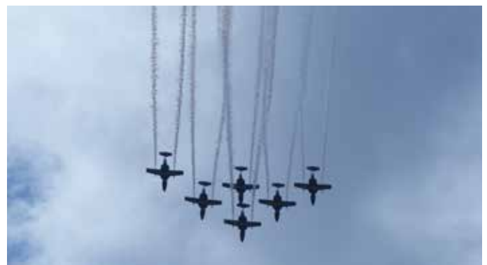
Flygskolan övar formationsflygning med Team 60