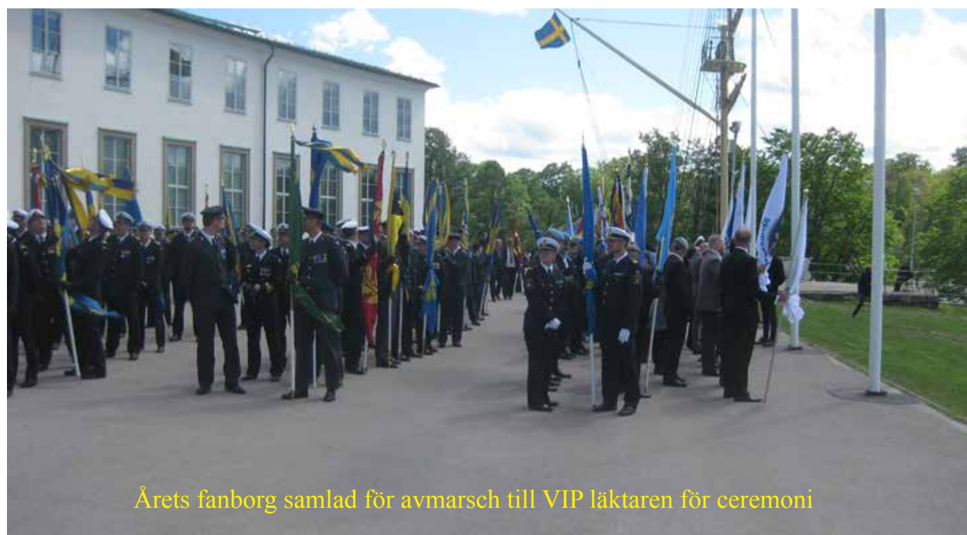
Årets fanborg samlad för avmarsch till VIP läktaren för ceremoni