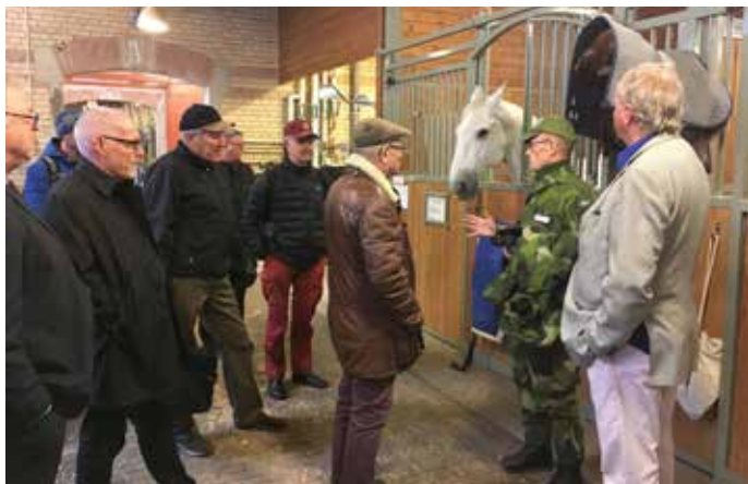
Före träffen med försvarsgrensrepresentanterna passade några på att få en visning av de vackra stallarna på kanslikasernen

SMKR genomför ett centralt möte för medlemsföreningarna vart annat år respektive ett representantskapsmöte (årsmöte) däremellan. I år var turen kommen till ett centralt möte. Vi samlades vid kasernvakten till kanslikasernen (gamla K1) för att vandra vidare till lektionssalarna över K 1 stallar.