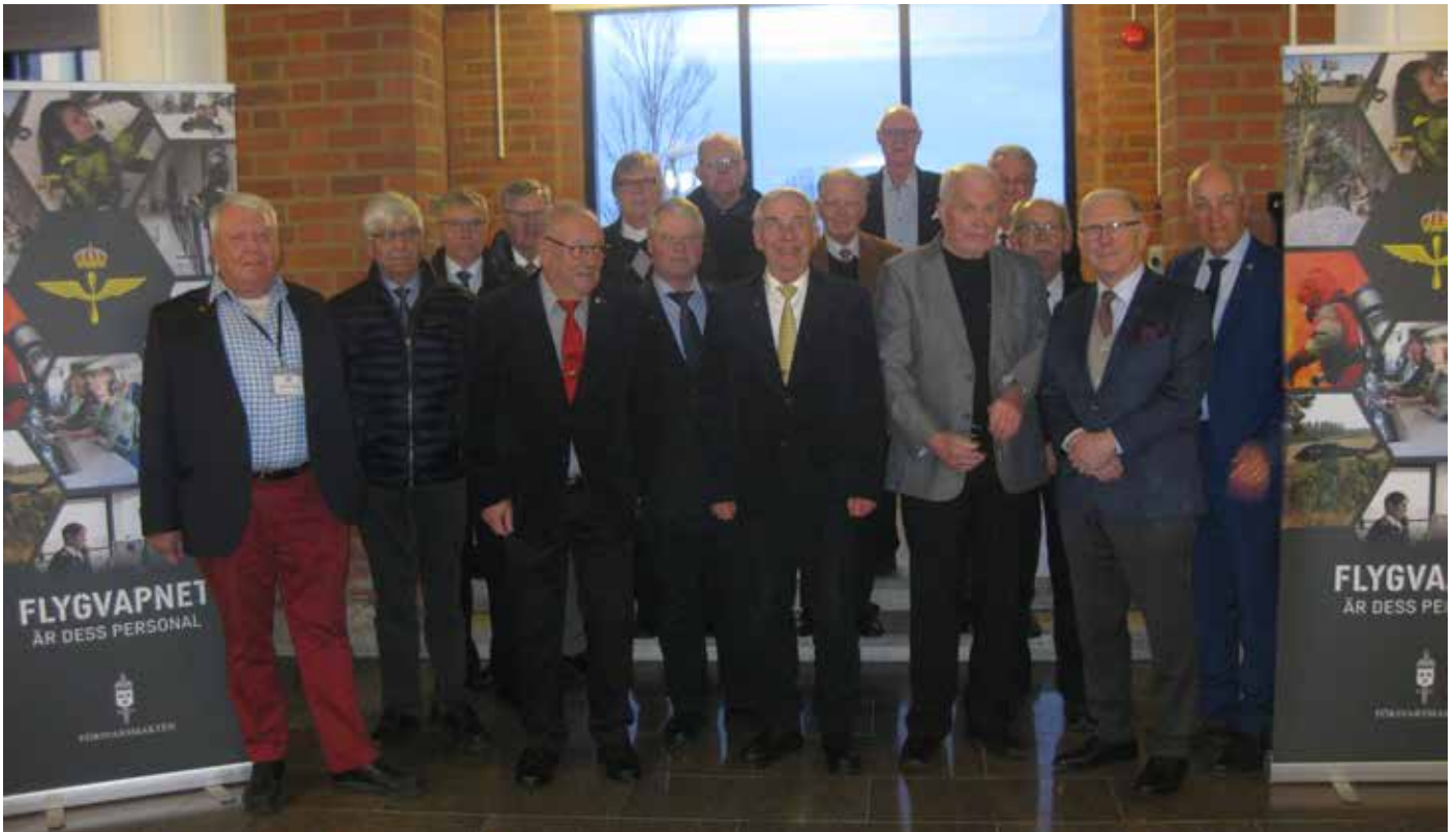
Här ser vi deltagarna samlade i före detta F 20 entré inför stabschefens information

Dag två kompletterade Sven Scheiderbauer med information kring de regionala mötena i SMKR samt kort historik kring SMKR.