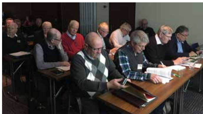
Intresserade och aktiva deltagare

Efter lunchbuffen fortsatte verksamheten och det blev en hel del spontana redovisningar med information om hur föreningarna lokalt har valt att genomföra verksamheter av olika slag. Det var goda ideer som nu alla kan ta med hem och pröva. Väl framme i Stockholm och Värtahamnen upplever jag att vi hade gått i mål med de flesta frågorna. Det blev ett intressant och nyttigt möte som kommer att generera lösningar och nya verksamheter på hemmafronten.