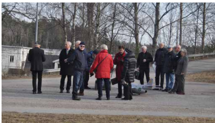
Samling inför ceremonin

Den 4 april samlades vi i vanlig ordning vid minnesstenen för att hedra dem som inte längre finns bland oss.