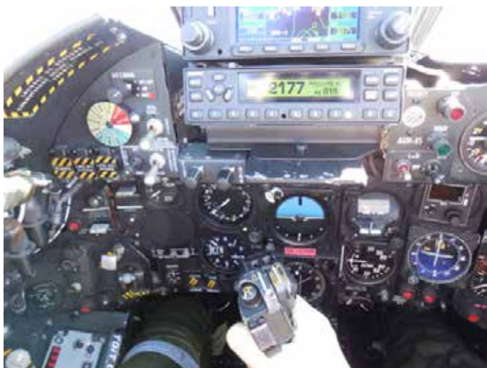
J 34 instrumentering