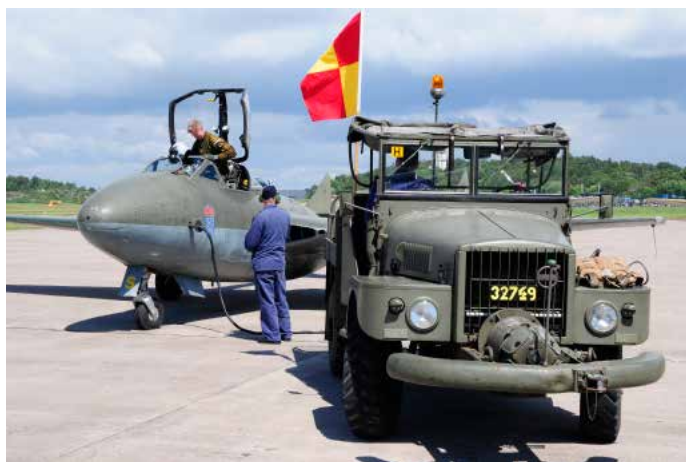
Klargöring av J 28

Det blev ett stort antal mycket fina bilder och de representerade många av de jettdrivna flygplantyper vi opererat med i flygvapnet.