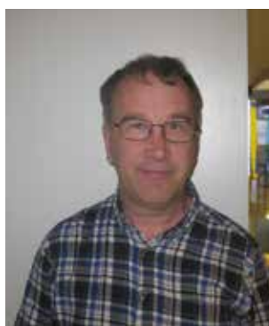
Ledamot och bildarkiv Thomas Lagman