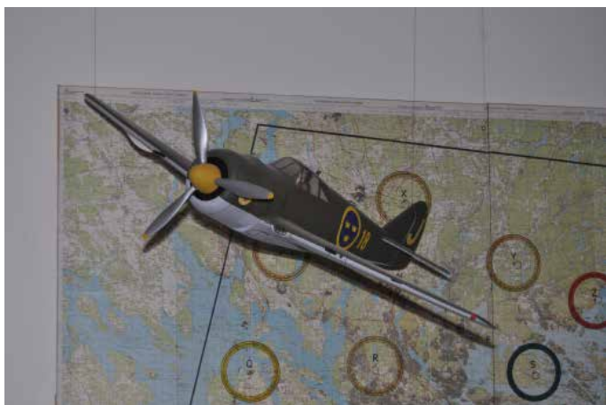
Vår J 22 i entrén till Sländan