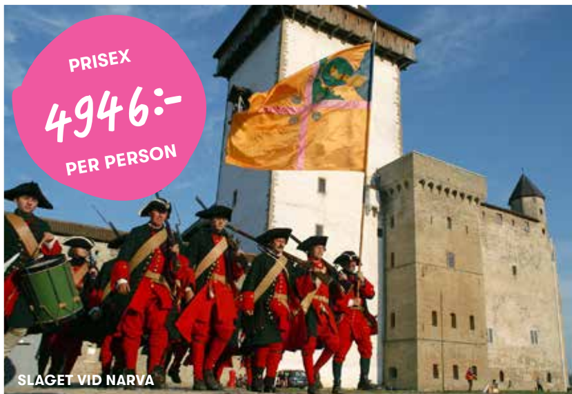
SLAGET VID NARVA