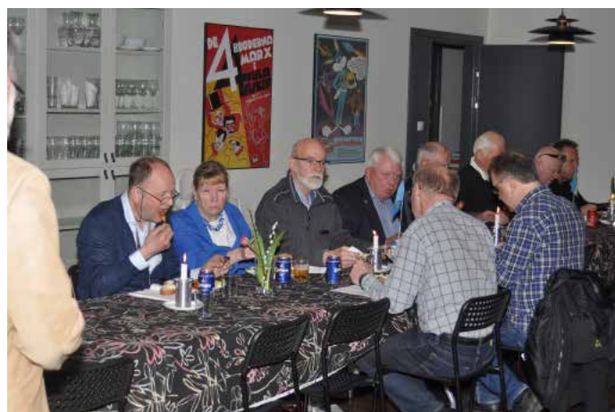
Fler deltagare som avnjuter maten

Allt har ju ett slut så även ett årsmöte. Tack alla i styrelsen, medlemmar och alla ni andra som bidragit till ett fantastiskt år med verksamhet, idéer och tänk, arbete, ekonomiska bidrag med mera. Nu tar vi nya tag och under 2019 blir det minst lika mycket om inte mer verksamhet än under 2018.