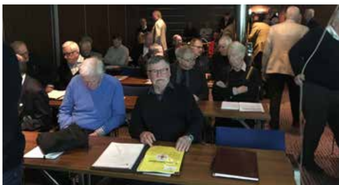
Deltagarna samlas i lektionssalarna med förväntan om intressanta och bra redovisningar

Mötet började med att försvarsgrenscheferna (representanter för) och Rikshemvärnschefen (stf chefen) tog emot och under en timme informerade respektive försvarsgrens medlemsföreningar om “den nya försvarsmaktsstrukturen” och dess arbetsinnehåll. Det blev även en del information om rekrytering och frågor kring ekonomin. Därefter blev det en timme med gemensamma frågor.