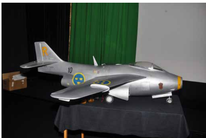
J 29 Tunnan snyggt uppställd i salongen